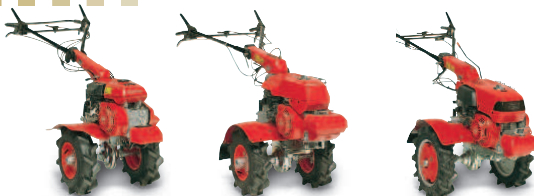
Illustrations montrent des accessoires.