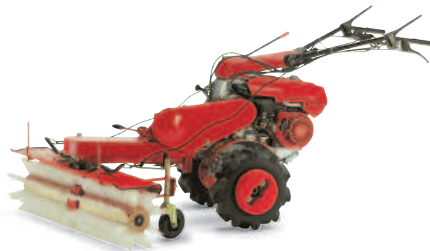
Balayeuse (F 720)