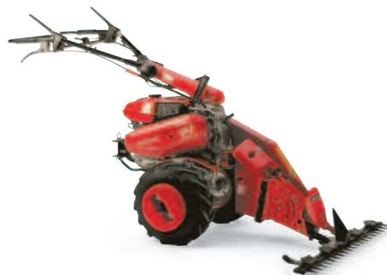
Barre faucheuse (F 560)

Votre concessionnaire Honda répondra à toutes vos questions sur l'ensemble de la gamme des accessoires destinés aux motoculteurs Honda. En Belgique la gamme des accessoires n'est que partiellement livrable.