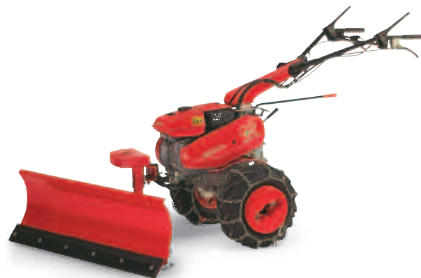
Équipement hivernal (F 560)

Ces illustrations montrent des accessoires non originels Honda.