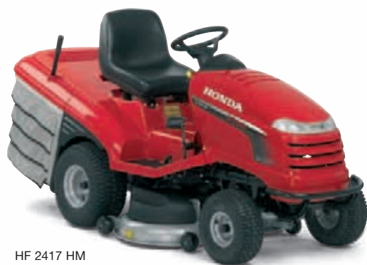
HF 2417 HM