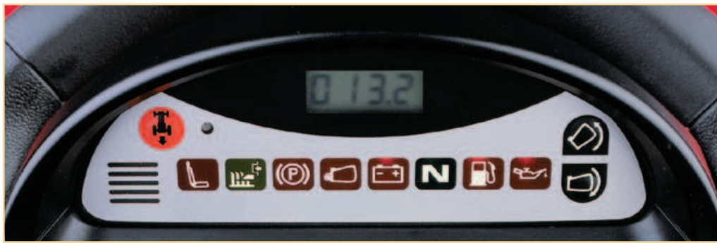
Tableau de bord multifonctionnel – clair et détaillé (à partir du HF 2315 HM)

Avec sécurité de tonte en marche arrière, cellule photoélectrique, voltmètre et compteur horaire, avertisseur sonore de bac plein, avec témoins pour : sécurité de siège, engagement des lames, frein de parking, présence du bac arrière, charge de batterie, point mort, manque de carburant, pression d'huile et la commande d'ouverture et de fermeture du bac de ramassage électrique (modèle HF 2620 HT).