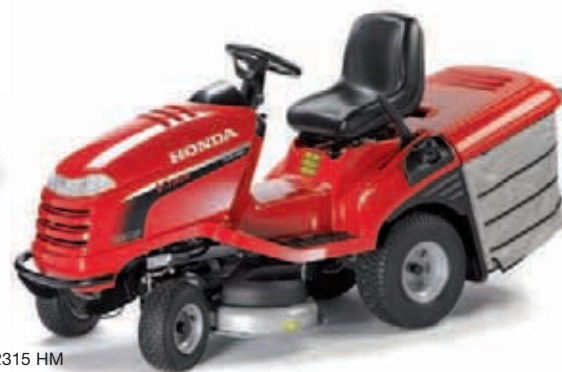
HF 2315 HM