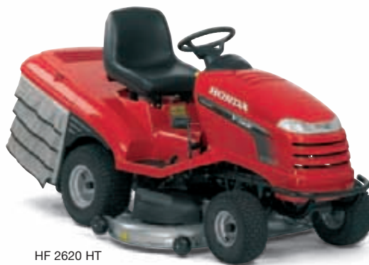
HF 2620 HT