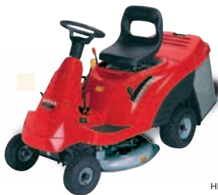
HF 1211 H