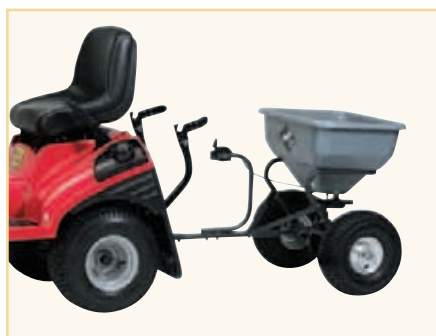
Epandeur sur roues*