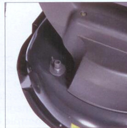
Plateau de coupe facile à nettoyer